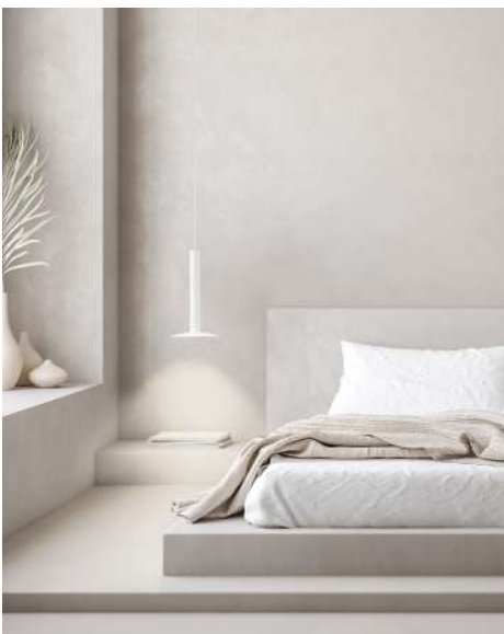
06744- BCN 30 250mm (False ceiling)